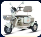
Q STAR II