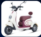
Q Q II